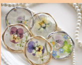
おひさま お花や天然石を使った手作り アクセサリの販売など