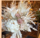
soeru flower ドライフラワー、プリザ花材販売 スワッグなどWS