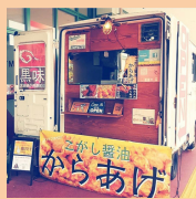
ファイブナイン からあげ