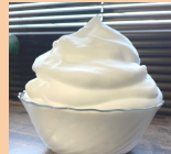
LINOLANA(リノラナ) もこもこ泡で冷え性解消 ハンドorフットトリートメント フェイクレザー小物販売