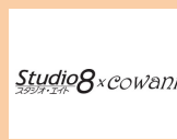
Studio8×cowanii studio8×cowanii メイクアップ体験 キッズメイク リボンアクセサリ販売