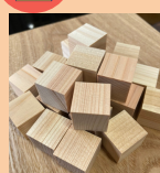
向井製材所 ひのきキューブ カッティングボードなど