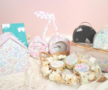
pieni.vari_ カルトナーージュ雑貨の販売 小物入れ、スマホスタンドなど