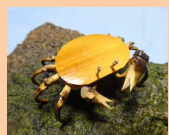
竹のおもちゃ教室 13:00頃〜 サワガニ&ブービー笛作り (約30分/1000円) 幼児から参加OK!