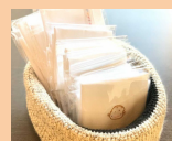
kuri.ran さらし布巾 (ほんわか刺繍入り)