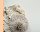
hanicome 帽子・アクセサリ 糸こもの