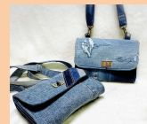
sasam デニムリメイク バック、小物等