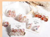
Le lien 主にレジンを使用した ハンドメイドアクセサリ